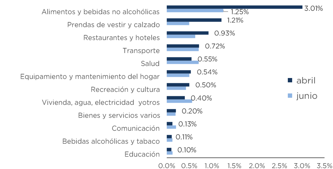
Incidencia por división: abril vs junio